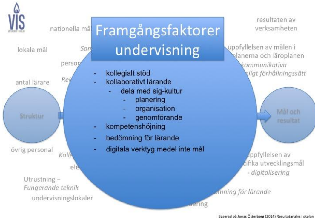
Figur 3. Framgångsfaktorer i utveckling av lärares undervisning.